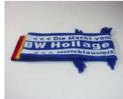
Fanschal 12,50 Euro