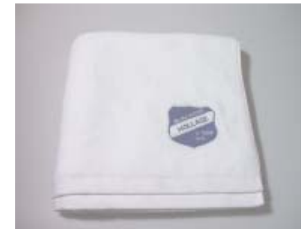
Sauna-Handtuch 27,50 Euro

Telefonische Bestellungen möglich bei Burkhard Böwer unter Tel. 05407/4463