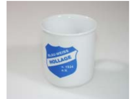
Kaffebecher 2,50 Euro