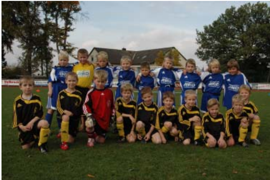
Gemeinsam Fußballspielen und Auflaufen: F-Junioren von Blau-Weiss und VfL