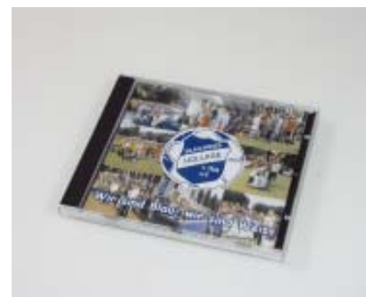
Vereinslieder-CD 9,50 Euro