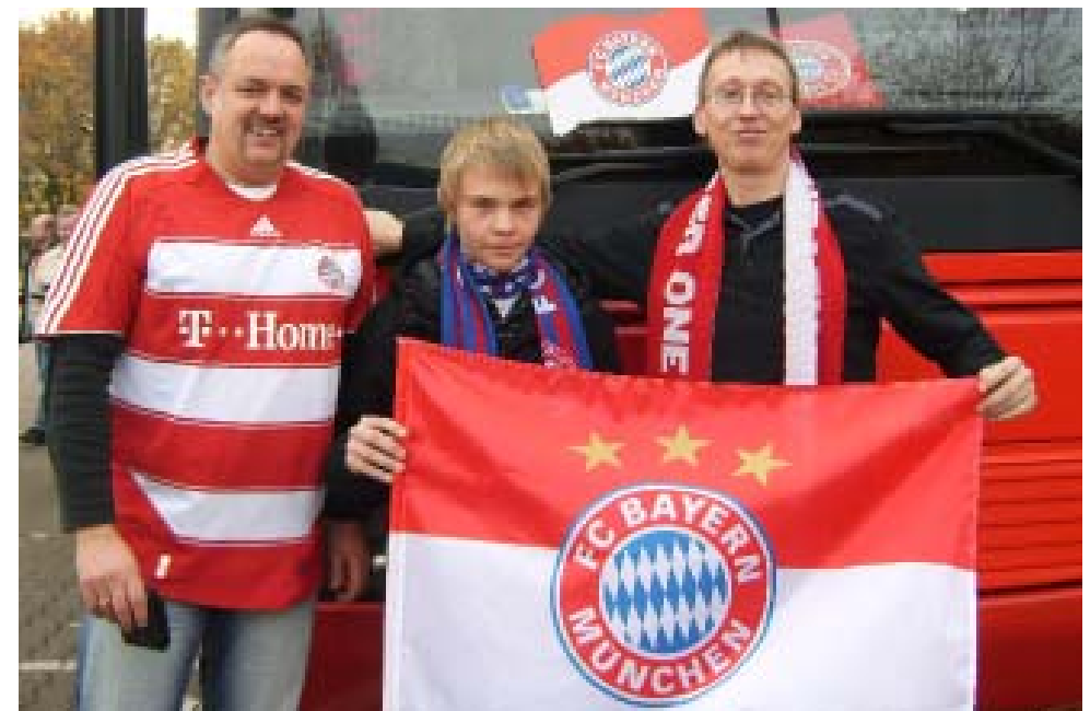
Der Präsident, der Fan, der Vizepräsident (v.l.n.r.)