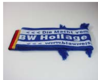
Fanschal 12,50 Euro