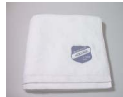
Sauna-Handtuch 27,50 Euro

Telefonische Bestellungen möglich bei Burkhard Böwer unter Tel. 05407/4463