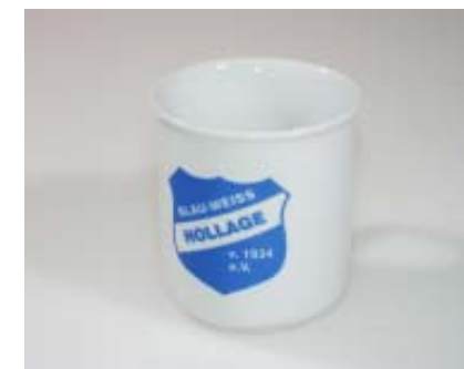
Kaffeebecher 2,50 Euro