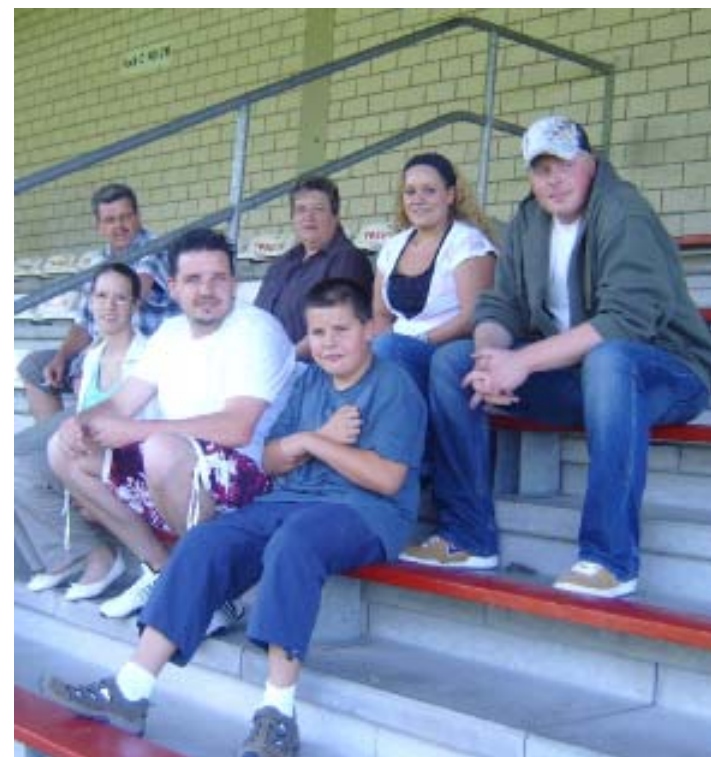
Einige der treuesten Fans von Blau-Weiss Hollage beim Hinspiel im Hindenburgstadion (6.000 Plätze) von Concordia Ihrhove