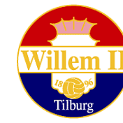
Willem II Tilburg (Niederlande)