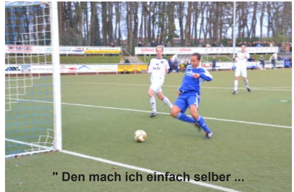
" Den mach ich einfach selber ...

SV Rasensport TSV Wallenhorst Blau-Weiss Hollage II