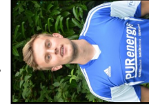
19 N. Lübben