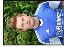
18 N. Lanwert