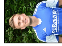
19 N. Lübben