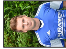
18 N. Lanwert