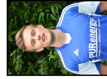
19 N. Lübben