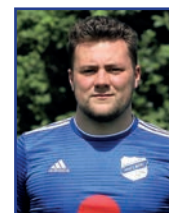
23 Löker Geb 13.07.2000