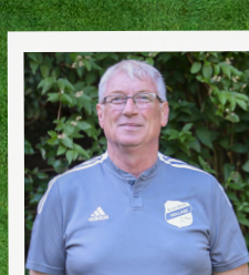
TM - G. BALLMANN