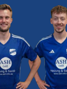
19 N. Lübben