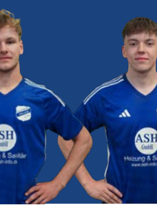
26 Fy. Voßgröne