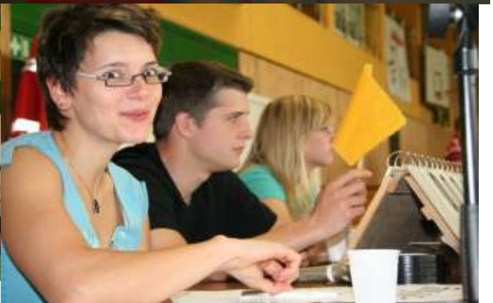
5.a Bericht des Sportwartes